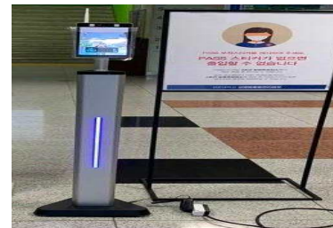
안면인식 열화상 감지 카메라